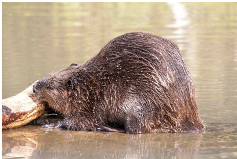
an den Bosch

Er komt ook een boek uit over de bever voor grote mensen en er is al een prentenboek voor kinderen over de bever